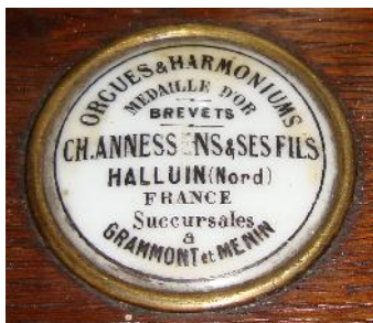
Merksnaam Anneessens Halluin