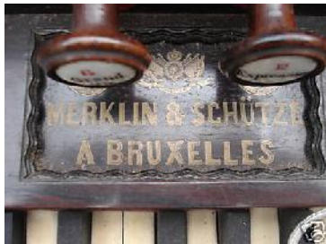
Merksnaam Merklin & Schütze