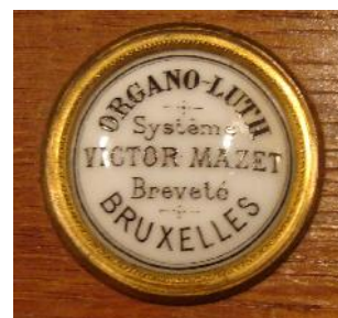
Medaillon Mazet- harmonium

Het is bekend dat hij tussen 1893 tot 1910 op een drietal verschillende locaties in Brussel zijn werkplaats had. Hij heeft enige tijd samengewerkt met de pianobouwer Hautrive in Schaerbeek. Op welke wijze is niet bekend. Van hem is bekend, dat hij een orgelharmonium ontworpen heeft, met een aantal vaste combinatieregisters. Zijn instrumenten werden gewaardeerd en stonden hoog aangeschreven. Zo is bekend, dat de componist Joseph Jongen zich bij het schrijven van zijn Trois Pièces (Prière du Matin, Angélus, Prière du soir) liet inspireren door een 2-klaviers kunstharmonium van Mazet, dat in het bezit was van Emile t' Serstevens. In het verslag van de eerste uitvoering van deze compositie wordt zeer lovend over dit instrument geschreven: "M. Jongen ... heeft de kwaliteit van het instrument duidelijk laten horen.... De klank is mooi, vol en rijk. Het volle werk in het bijzonder."