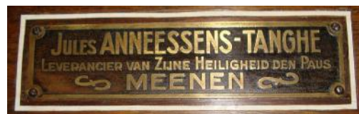
Een tweetal merkplaatjes van Jules Anneessens. Zou toen al in België de gebruikte taal op de naamplaatjes gevoelig gelegen hebben...?