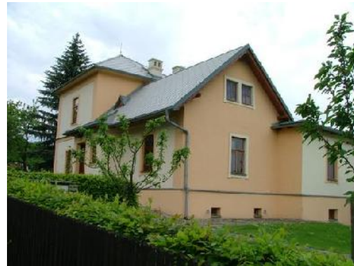
Het zomerhuis in Hukvalda, dat door de componist in 1921 werd aangekocht. Op de tweede verdieping ziet men de kamer, waar Kamila Stösslová logeerde.

beschouwde. Janáček werd 3 juli 1854 in Hukvaldy geboren, een klein dorp in het noordoosten van Moravië, als zoon van een onderwijzer. Het is een gebied, waar de natuur als een vanzelfsprekendheid domineert en Tsjechisch wordt gesproken. Hukvaldu laat zich vertalen met: Hochwald, Hoge Bossen.