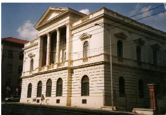
Janáček Conservatorium in Brno

schaduw op zijn huwelijk met Zdenka Schulzová, een leerling van hem, met wie hij in 1881 trouwde. En dan, in het jaar 1917, komt Kamila Stösslová in zijn leven. Zijn leven verandert. Zij wordt zijn muze. In de 12 jaar die daarna volgen, is hij creatief en succesvol en componeert vele werken.