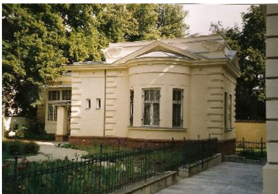
Zijn woonhuis in Brno