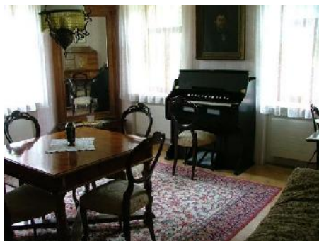
Het harmonium van Janáček