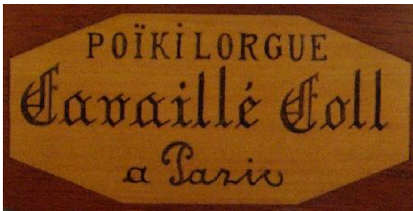
Naamaanduiding op de nieuwere Poikilorgues