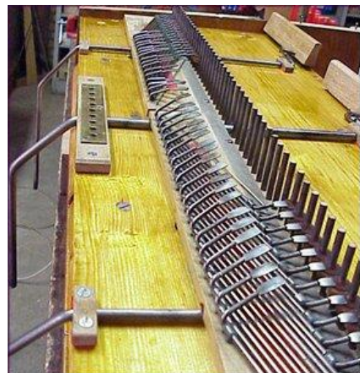
Het binnenwerk na restauratie: een 'gewoon' zuigwind