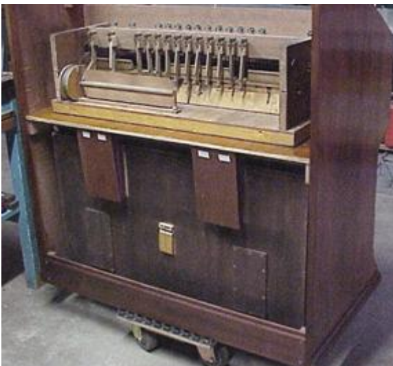
Achterzijde, met de beide expressions-balgies aan bas- en diskant