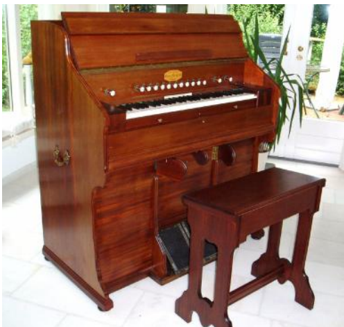
Voorraanzicht Poikilorgue nr. 30

Het Expression register (simple of double) geeft alle sterkte mogelijkheden: van ppp tot fff.”