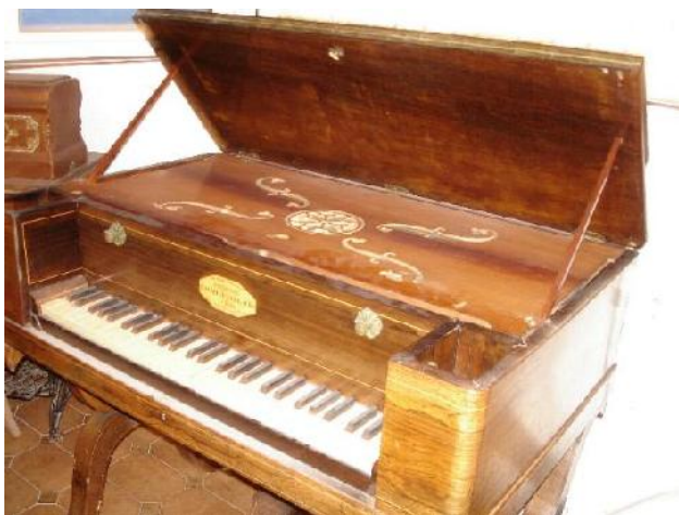
Poikilorgue uit privé bezit, Parijs

Van deze vroege drukwindinstrumenten zijn twee modellen bekend waarvan het grootste met vijf oktaven vanaf FF, alsmede een Piano-Poikilorgue, die onder een vleugel paste. Allen hadden slechts één spel. Van deze instrumenten, die tussen 1832 en 1847 moeten zijn vervaardigd, zijn er nog slechts vier bekend. Een vijfde exemplaar werd onlangs op een veilingssite in Frankrijk aangeboden. Opmerkelijk is het bericht dat deze instrumenten door Cavaillé-Coll niet geheel evenredig zwevend gestemd zouden zijn: slechts één grote terts is gelijkzwevend (op La - Do). In het octaaf zijn 7 minder zwevende tertsen hoorbaar (en dus meer rein klinkend) en 4 méér zwevend. Dit zou overeenkomen met de bevindingen bij de restauratie in 1987 van het St. Denis-orgel uit 1841.