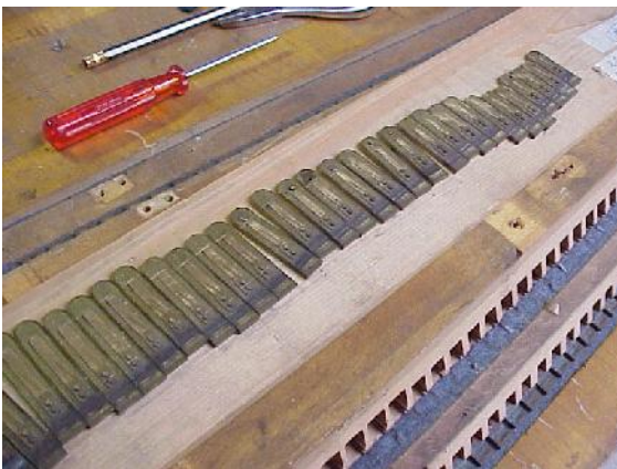
De cancellen en tongen tijdens de restauratie