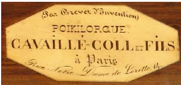
Naamaanduiding op de eerste Poikilorgues