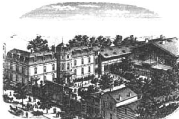
Bedrijfspanden aan de Avenue de Maine

om voor de L'église Royale de Saint Denis in Parijs een groot kerkorgel van 69 stemmen te bouwen, verhuisde het bedrijf naar Parijs. Werkplaatsen waren achtereenvolgens in de Rue Notre-Dame-de-Lorette / Rue La Rochefoucault / Rue de Laval / Rue de Vaugirard en sinds 1868 het ruime complex aan de Avenue du Maine 13-15.