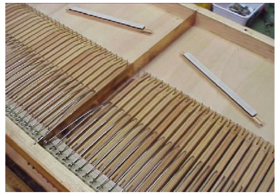
Onderkant zangbodem, met de ventielkleppen en deling bas/ diskant t.b.v. de expression