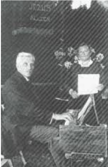
Johannes de Heer met zijn vrouw. Hij bespeelt een draagbaar harmonium. 19 De muziekstandaard is het deksel van het orgel.

De invloed van Johannes de Heer op het evangelisatiewerk in Nederland is heel groot. Wanneer in 1924 de NCRV opgericht wordt, bereikt hij via zijn radiowerk veel luisteraars. Tijdens deze Liederenuurtjes begeleidt hij zichzelf op het harmonium. Tot op hoge leeftijd verzorgt hij uitzendingen. Van zijn zangbundel met alleen de teksten zijn ruim 1.000.000 exemplaren verkocht, van de muziekbundel ruim 300.000. In 2004 verscheen er een jubileumuitgave ter gelegenheid van het feit dat de bundel 100 jaar geleden voor het eerst uitkwam. De inhoud is nog grotendeels dezelfde als de eerste uitgave, maar er is ook een keuze gemaakt uit meer eigentijdse liederen. Nog steeds worden deze liederen gezongen, met name door ouderen: vanwege de troostende en bemoedigende geloofsinhoud, de herkenbare taal, de bekende melodieën en vanwege de herinneringen die de liederen oproepen. Zelf heb ik ook jaren vanuit het evangelisatiewerk met een groep dames gezongen uit deze bundel en ervaren welke waarde de liederen voor de mensen hebben.