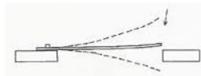
tong, van bovenaf gezien, in rust, in zijn windkamer, de cancel